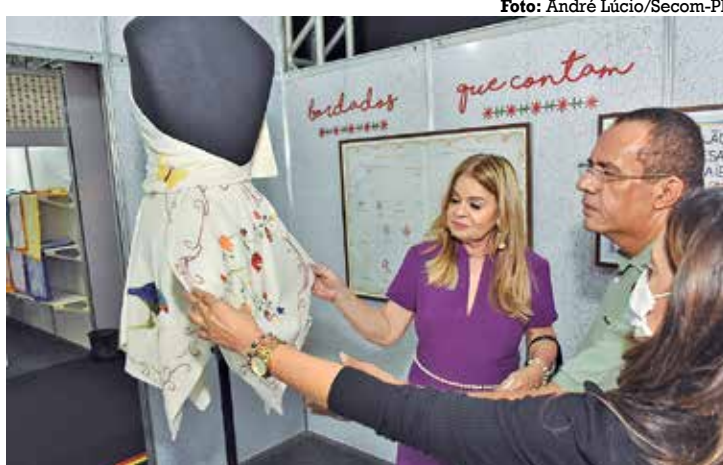
Primeira-dama também esteve no Salão do Artesanato, em CG