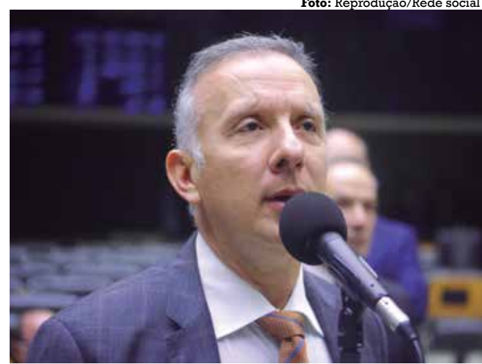
Deputado federal do Progressista dará uma entrevista coletiva

A CTE foi instituída por meio da Portaria nº 578, de 8 de setembro de 2021, para ampliar a transparência e a segurança de todas as etapas de preparação e realização das eleições; aumentar a participação de especialistas e entidades da sociedade civil e instituições públicas na fiscalização do processo eleitoral; e, por último, contribuir para resguardar a integridade do processo eleitoral.