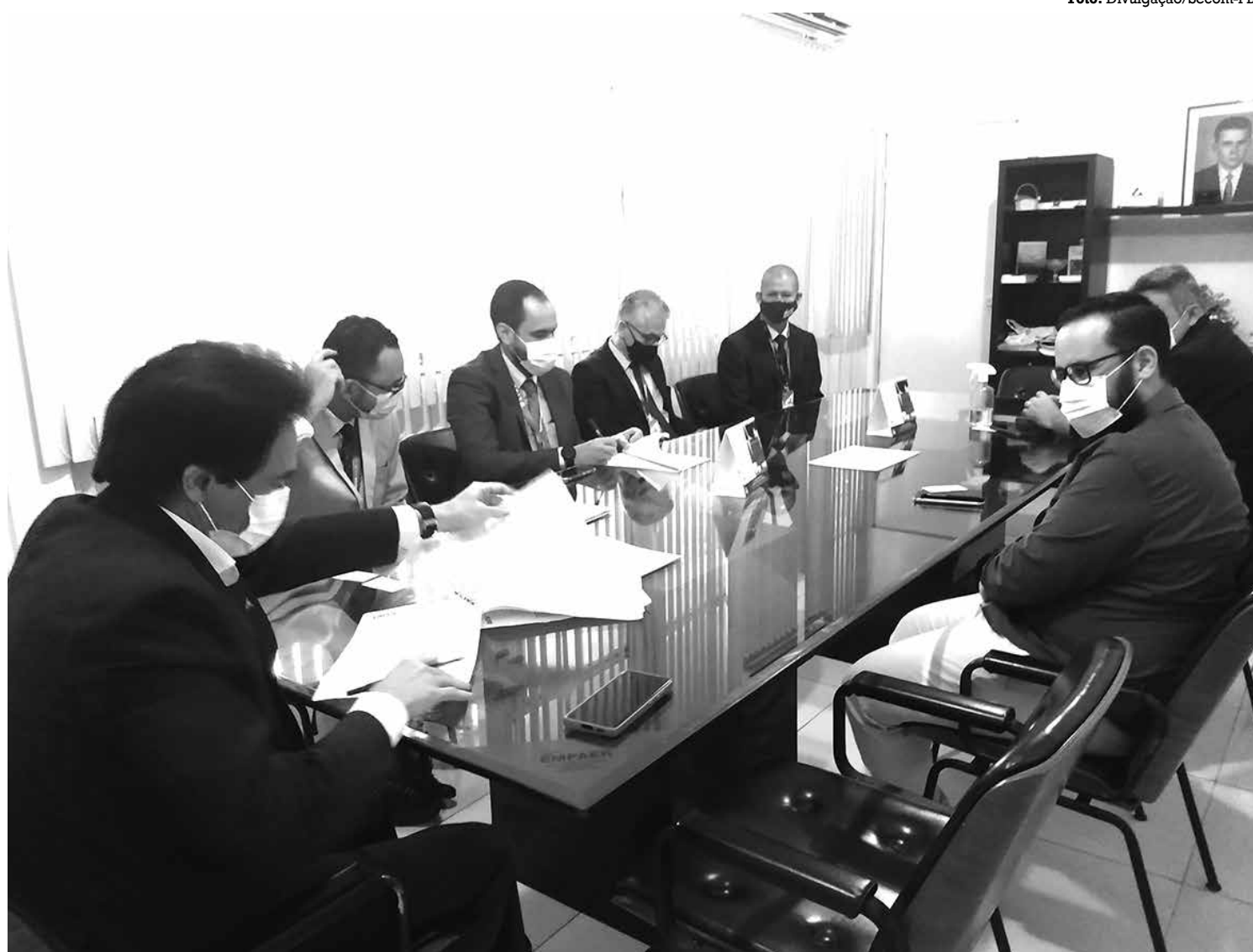
Acordo levou em consideração a atuação da Empaer em assistência técnica, que contribui para a educação continuada no meio rural

Caixa levou em consideração que a assistência técnica e extensão rural praticadas pela Empaer contribuam para uma educação continuada no meio rural, que busca viabilizar junto às famílias soluções adequadas para os problemas de produção, gerência, beneficiamento, armazenamento, co-