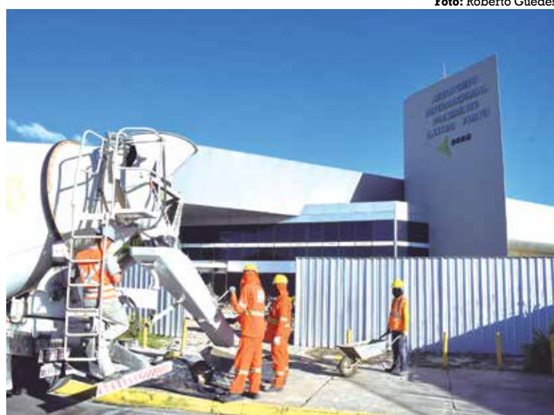
Algumas áreas do Castro Pinto estão fechadas para realização da ampliação

No Aeroporto Ariano Suassuna, a entrada do terminal está em obras e foi construída uma outra via de acesso, temporária. Na sala de embarque, há a construção de um banheiro e, para o desembarque, está se utilizando uma sala provisória. O estacionamento de veículos também passa por inter-