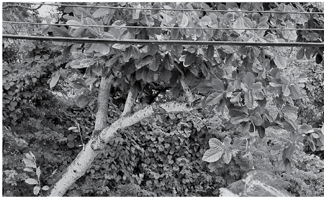
Sobrevivência e diversão