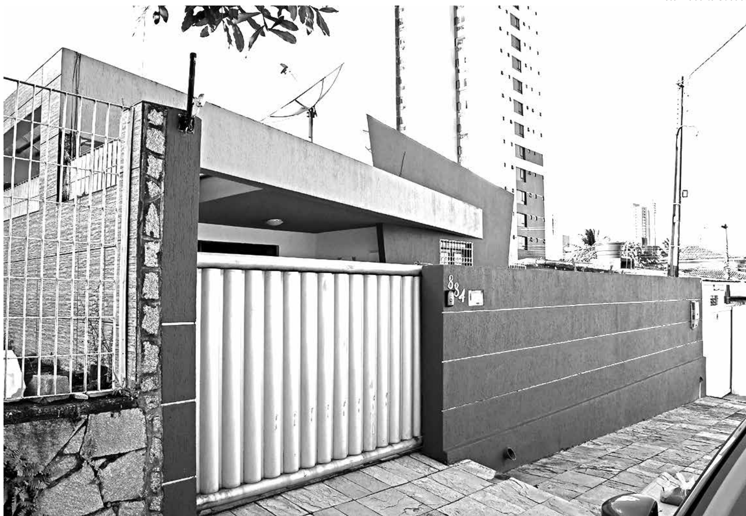
Casa de acolhida, em Tambauzinho, tem capacidade para receber, provisoriamente, até 25 pessoas durante um período de até 120 dias

Criada para atender à população LGBTQIAP+ em situação de rua, abandono familiar e em situação de violência, o serviço essencial e de alta complexidade é coordenado pela Secretaria de Estado da Mulher e da Diversidade Humana. O serviço tem capacidade de acolher provisoriamente até 25 pessoas durante um período de até 120 dias. Os casos serão encaminhados após atendimento nos Centros de Referências dos Direitos de LGBTQIAP+ e Enfrentamento à LGBTQIAP+fobia de João Pessoa e Campina Grande.