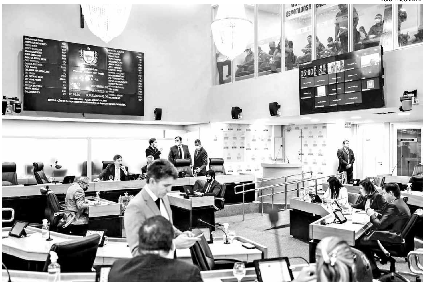
Deputados destacaram a harmonia entre o Legislativo e o Executivo e os benefícios que essa relação traz para o povo paraibano

“O diálogo com o Poder Executivo tem permitido cada vez mais que a Casa de Epitácio Pessoa possa trabalhar em harmonia para buscar um estado mais digno para todos os paraibanos. As pessoas moram nos municípios e vamos buscar, cada vez mais, ajudá-los, com este mecanismo”, completou o presidente.