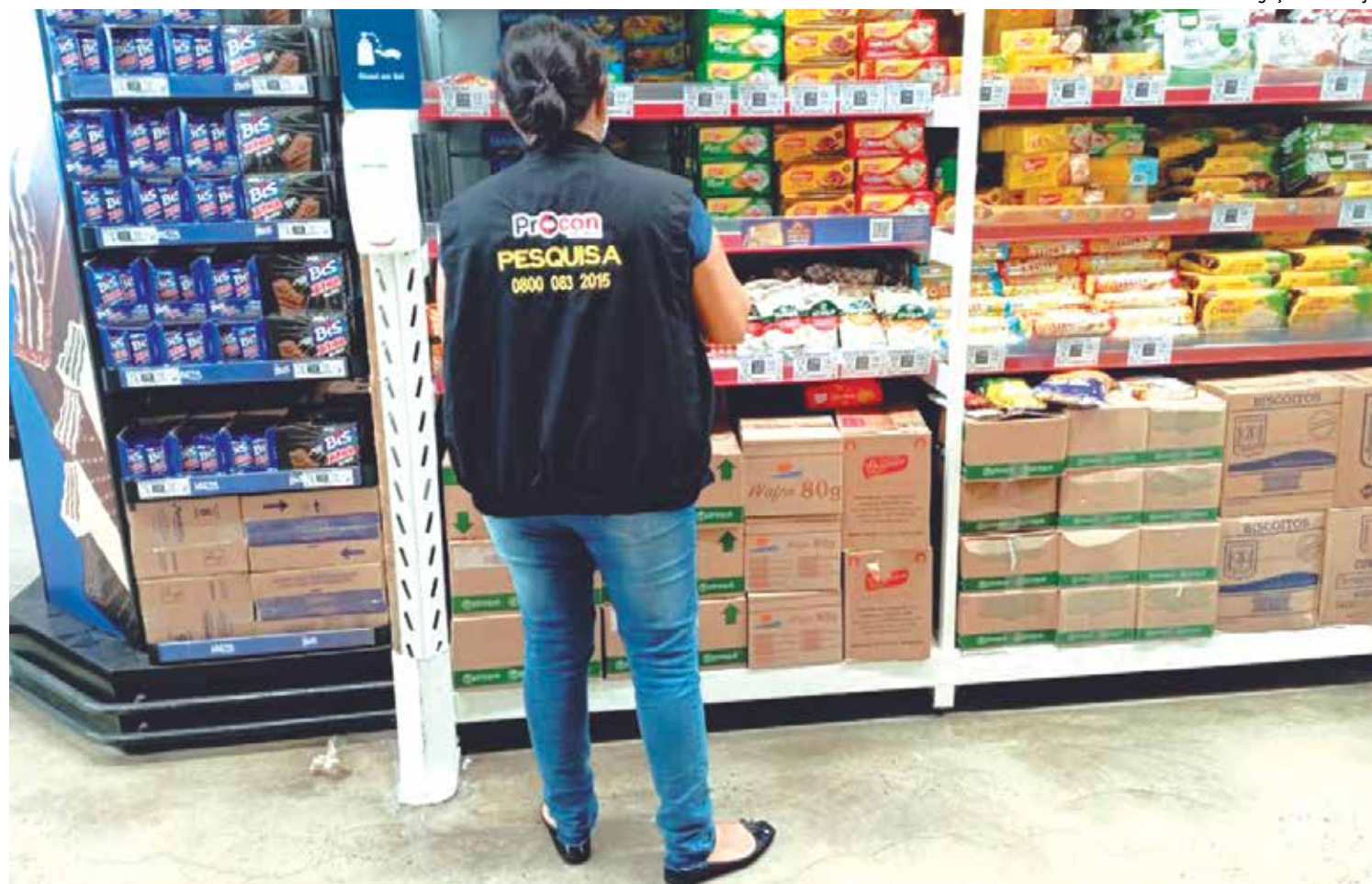
Levantamento do Procon-JP foi realizado no dia 13 de junho e comparou os preços de 76 itens coletados em 17 estabelecimentos