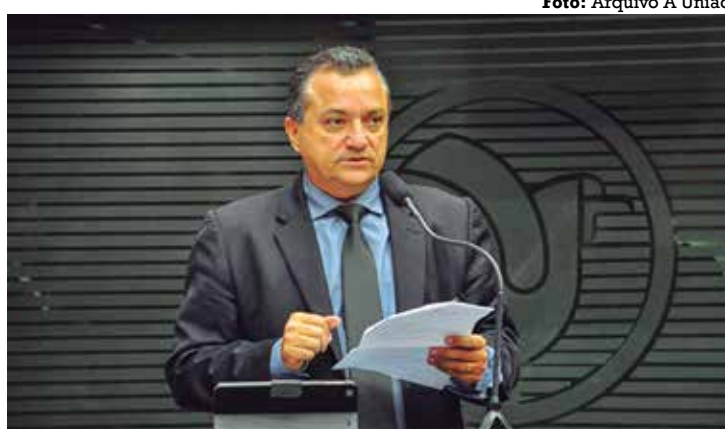
Segundo Marialvo, governos estaduais deverão recorrer à Justiça

Entre as mudanças, está a proposta de uma compensação aos estados com o abatimento de dívidas com a União, quando a perda de arrecadação passar de 5%. Os governos não endividados terão priori-