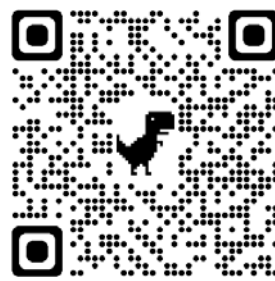
Através do QR Code acima, acesse o canal da Funesc no YouTube