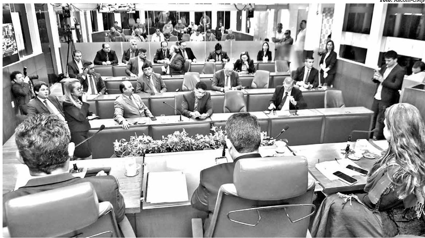
Os vereadores autorizaram a Prefeitura a instituir o serviço social autônomo que vai proporcionar o incentivo à tecnologia

O Plenário da Casa Napoleão Laureano também aprovou, ontem, outras matérias do Executivo Municipal. Entre elas destaque para um projeto que autoriza a Prefeitura a desativar e indicar para outro fim a área originalmente destinada à Rua Bahia, no Bairro dos Estados, modificando sua destinação, mediante transferência de categoria de uso comum, para uso especial, para a construção do Hospital Veterinário Municipal.