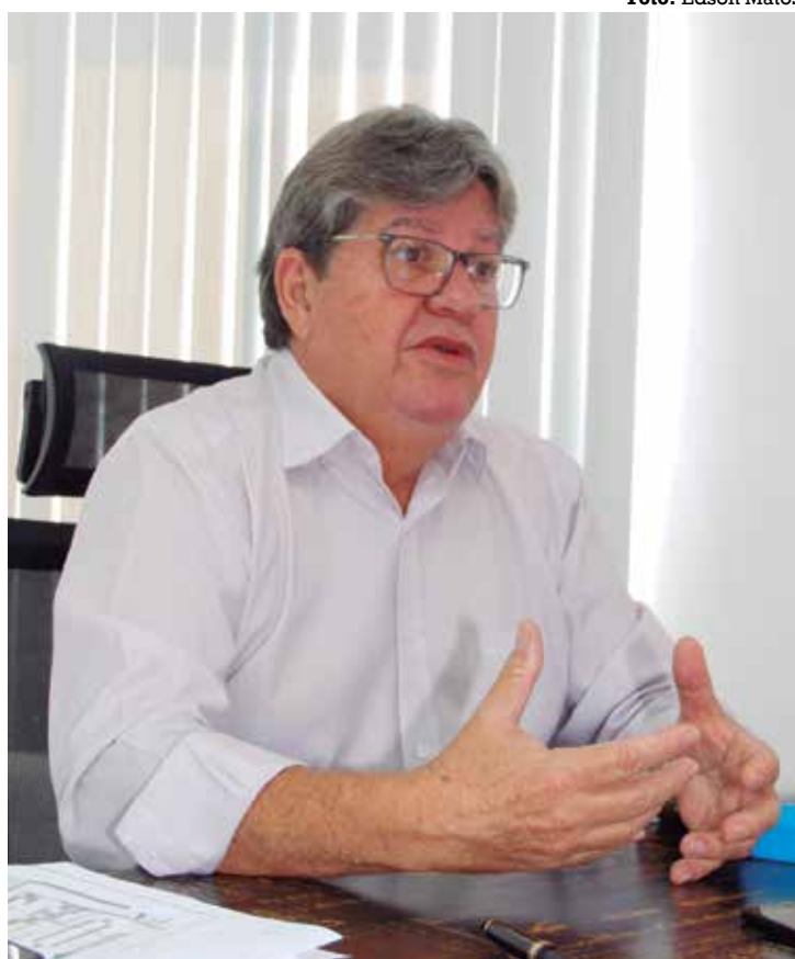
João Azevêdo e demais governadores se encontram com Lula amanhã, em Natal, onde o ex-presidente irá abordar o tema "Fome no Brasil"

Esse é o primeiro compromisso de Lula e do ex-governador de São Paulo, Geraldo Alckmin (PSB), no Nordeste,