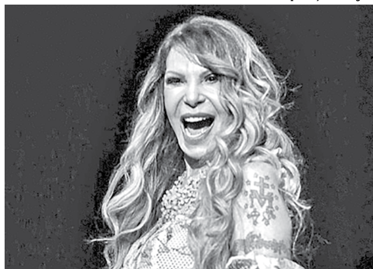
Elba Ramalho apresenta sintomas leves e cumpre repouso