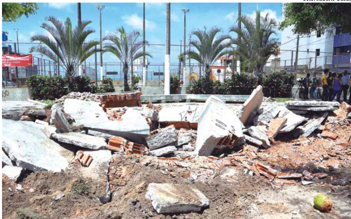
Destruição da praça faz parte, atualmente, do cenário; moradores e comerciantes se dividem sobre o futuro do lugar

Em relação ao trânsito, ela acredita que existem obras mais importantes em áreas conges-