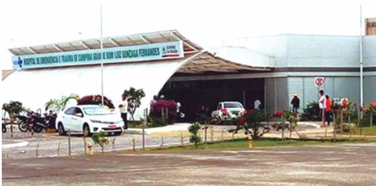
A avaliação é nacional e é realizada em todos os hospitais do país que possuam leitos adulto de Unidade de Terapia Intensiva

(8) [PDF] Termo Aditivo: Doc. 03603/22. Data: 12/01/2023 16:01. Responsável: Carlos A. L. Sarmiento.