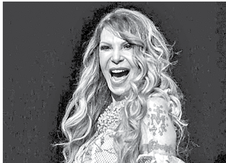
Elba Ramalho apresenta sintomas leves e cumpre repouso