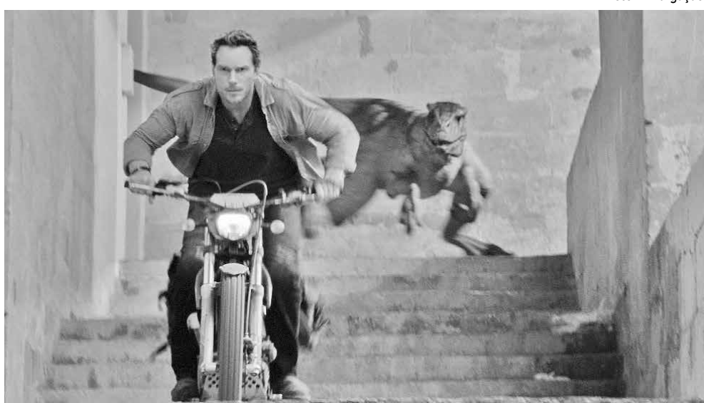
Ex-funcionário do parque, Chris Pratt foge dos dinossauros em 'Jurassic World: Domínio'

AHORA DO DESESPERO (The Desperate Hour. EUA. Dir: Phillip Noyce. Thriller e Suspense. 14 anos). Uma mãe recentemente viúva, Amy Carr (Naomi Watts), está fazendo o possível para restaurar a normalidade na vida de sua filha e de seu filho adolescente em sua pequena cidade do interior. Enquanto ela está fazendo sua corrida matinal na floresta, ela encontra sua cidade no caos quando um tiroteio ocorre na escola de seu filho. A quilômetros de distância, a pé na floresta densa, Amy corre desesperadamente contra o tempo para salvar seu filho. CINÉPOLIS MANAÍRA 1: 16h (dub.) - 20h15 (leg.) - 22h15 (leg.).